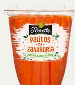
Palitos de Zanahoria