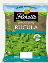
Pack de PB Rúcula